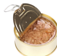
Puszka tuńczyka w sosie własnym