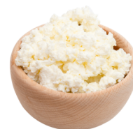
Twaróg półtłusty / ser biały