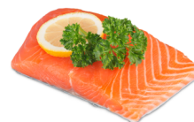
Łosoś wędzony, plaster