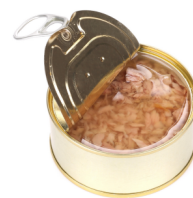
Puszka tuńczyka w sosie własnym