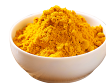
Curry w proszku