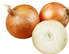
Cebula, słodka, surowa