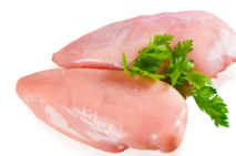
Pierś z kurczaka