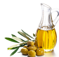
Oliwa z oliwek